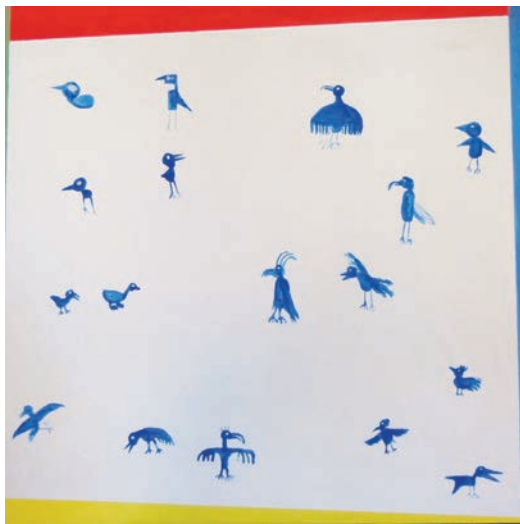
Armin: Von Pleitegeiern und anderen Vögeln / Acryl