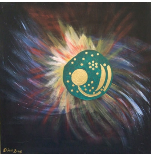
Erich: Himmelsscheibe von Nebra / Acryl