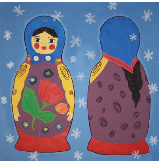
Elena, Matröschka / Acryl