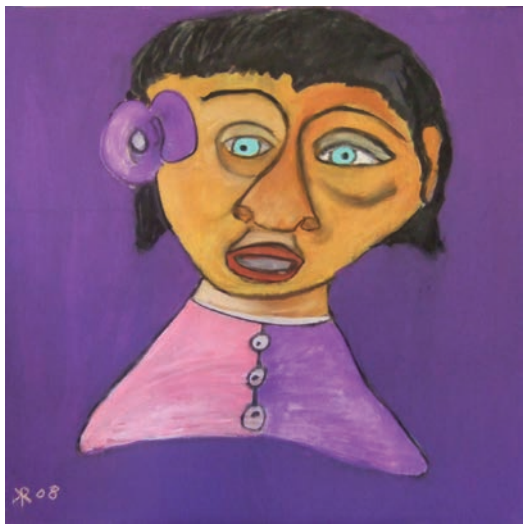
Rolf: Frau mit Blume / Acryl