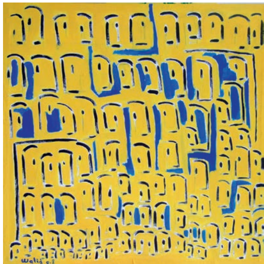
Walid: Gelbe Stadt / Acryl

ZUM DANK EINEN QUADRATMETER KUNST ! DAS KÖNNTE IHR KUNST-m 2 SEIN!